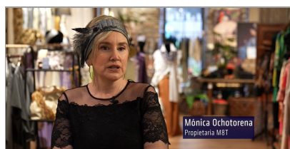
Donostia - San Sebastián, M8T