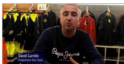
Barcelona, Dox Style