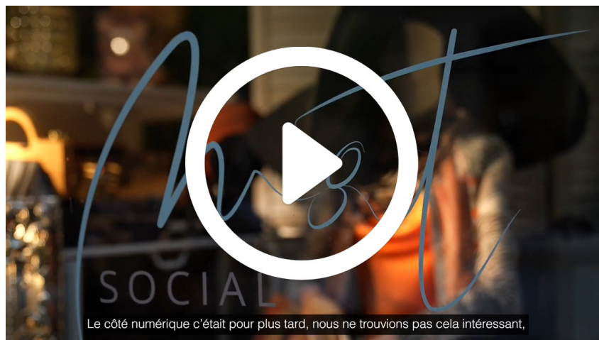
Vídeo resumen Proyecto CORE