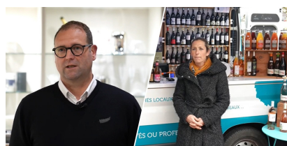
Pau, Gallazzini-Arts de la Table et de la Cuisine y Pau, Cav'Ambul